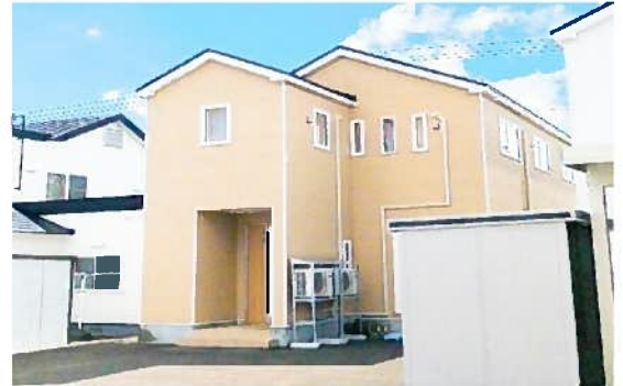
※外観は①の建物です